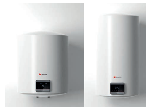
Acumuladores de 80 litros, versão Standard, à esquerda, e Slim à direita